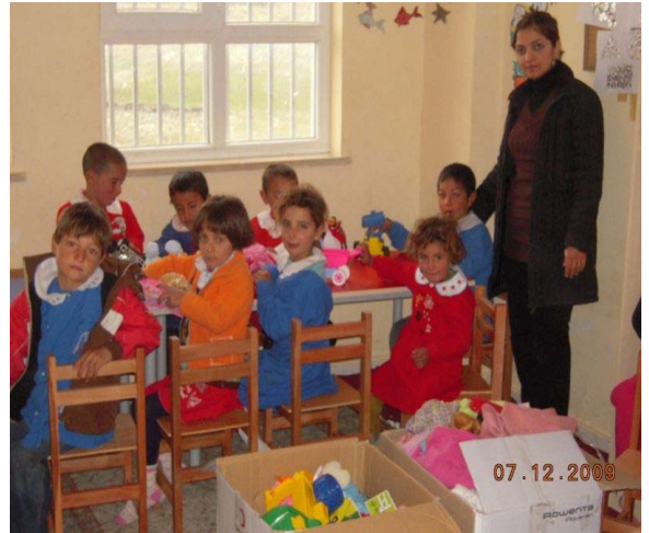
Kardeş Okul Resimleri