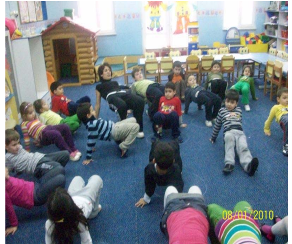
Elektrik Akımı Oyunu