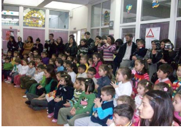
Aile Katılım Etkinlikleri

Milli Eğitim Bakanlığının okul öncesi eğitim kurumları için programa dahil ettiği aile katılımı etkinlikleri kapsamında, ailelerden elektrik ve su faturaları öğrencilerimiz aracılığı ile okulumuza ulaştırılmıştır. Ailelere yapabilecekleri ve okulla paylaşabilecekleri etkinlikler gönderilmiştir. Velilerimizin de bu konuda çok duyarlı oldukları gözlenmiştir. Ayrıca geri dönüşümlerde düzenli olarak toplanmıştır.