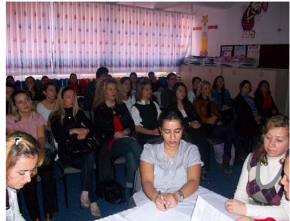
Veli Bilgilendirme Toplantısı

2009- 2010 eğitim öğretim yılı içinde eylül ayında velilerimizle yapmamız gereken I. Dönem başı veli toplantısında, eko konumuz anlatıldı ve okulda olduğu kadar evde de bu konunun üstünde durulması gerektiği velilere aktarıldı. Okulumuz web sayfasında projelerimiz bölümünde enerji tasarrufu konusunda velilerimiz için açıklayıcı bilgilere yer verildi. Ayrıca çocukları ile eve gelen elektrik ve su faturaları hakkında az mı, çok mu olduğu konusunda bilgi paylaşımı yapmaları ve gerekli önlemleri almaları konusunda anlayabilecekleri dilde konuşmaları istendi