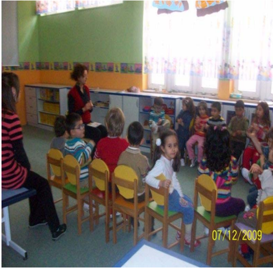
Tekerleme ve Parmak Oyunları

Öğrencilerimize Türkçe dil etkinliklerimizde enerji tasarrufu konulu şiirler ve özlü sözler öğrettik. Çocuklarımıza enerji tasarrufu ile ilgili atasözleri ve deyimleri , 5-6 yaş grubunun somut ve soyut düşünme yeteneklerini aşmadan anlamları ile birlikte özümsemelerini sağladık. Sağlıklı beslenme, geri dönüşüm maddeleri ve bunlardan nasıl yararlandığımız ile ilgili hikayeler oluşturarak, öğrencilerimizin doğaçlama yöntemiyle hikayenin sonunu getirmelerini sağladık. Okulumuzda yer alan cam, pil, şişe, kağıt geri dönüşüm kutularını ve işlevlerini tanıttık. Tekerleme ve parmak oyunları öğrettik. Öğrencilerin evlerinde " ENERJİ DEDEKTİFİ" olarak neler yaptıklarını, anne ve babalarını, kardeşlerini su ve elektrik kullanımı konusunda nasıl uyardıklarını kendi anlatımlarıyla arkadaşları ile paylaşmalarını sağladık.