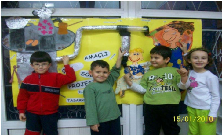
Enerji Tasarrufu Haftası