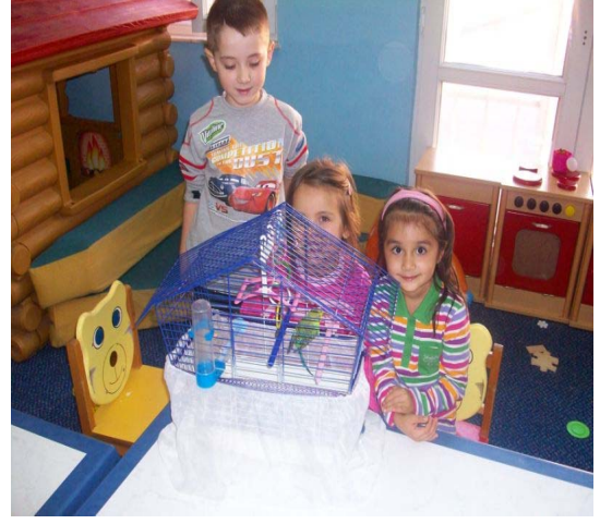
Hayvanları Sevmeyi Öğrendik.