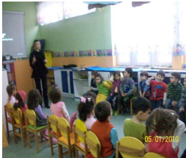
Dedektiflik Görevi Anlatımları