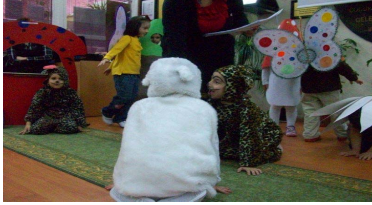
Hayvanları Koruma Günü

Eko- Okul eylem planımızda belirlediğimiz, eğitim etkinliklerimizle bağlantılı olarak HAYVANLARI KORUMA GÜNÜ- KIZILAY HAFTASI-ENERJİ TASARRUFU HAFTASI , öğrencilerimizin öğretmenleri rehberliğinde hazırladıkları programlar ile kutlandı ve okul web sayfamızda yayımlandı.