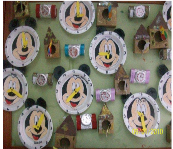
Artık KaĖıt Proje alıřması