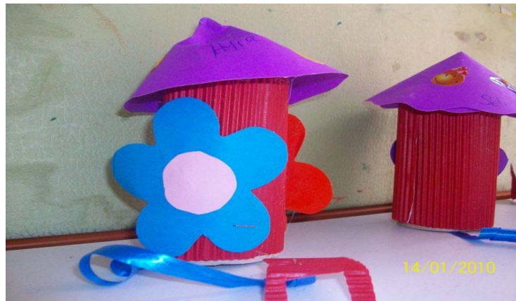
Lamba Proje alıřması